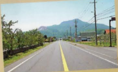
そうべつフルーツ街道