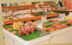
農産物直売所サムズ